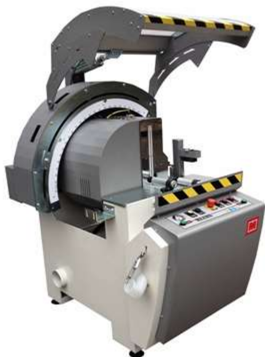
Diagramma di taglio troncatrice Fast con lama Ø 600mm (toleranza ±3mm)